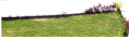
Imagem 01: Playground e Ginásio Poliesportivo